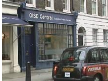
Edificio de la Escuela (arriba del Burger King) Executive Centre